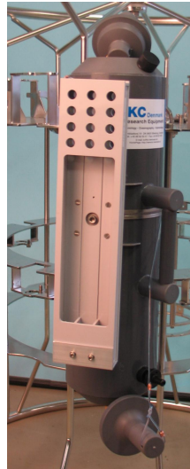
可放置 3 根颠倒温度计的支架