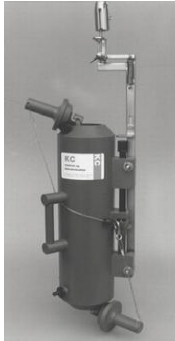
单独使用的 Niskin 采水瓶

当 Niskin 采水瓶单独使用时，需要 1 个中间安装支架(60.002)，同时需要 800g 使锤(60.004)